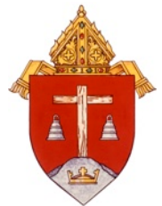
Image from Our Lady of Loretto church in Cold Spring, New York

Resource created by the Diocese of Monterey, Department of Catechetical Ministries